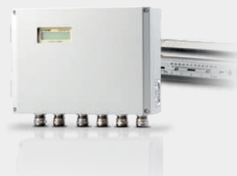
FLUXUS® F704E стационарный

Цены на энергию поднимаются, требования законодателя по эффективности оборудования становятся жестче. Поэтому очень важно достичь максимальной эффективности потоков тепловой энергии. Расчет потоков энергии играет важную роль во многих применениях: при поставке теплоты из теплоэлектростанции к конечному потребителю, при передаче тепла для химических промышленных процессов.