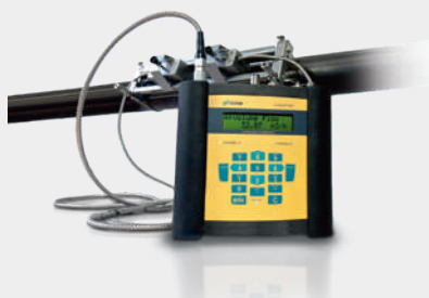
FLUXUS® F608E портативный