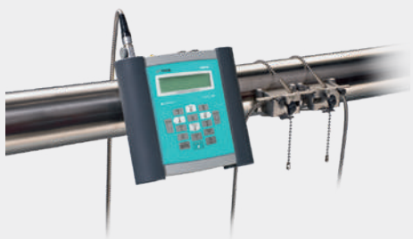
FLUXUS® F601E портативный

Для измерений расхода тепловой энергии (E) в водяных системах.