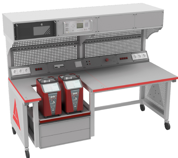
Метрологический стенд для поверки СИ температуры с дополнительной полкой для калибраторов температуры

По дополнительному заказу конструкция метрологического стенда может быть изготовлена в нестандартном исполнении.